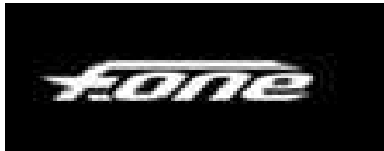
- PACK VOLT 2011 + NEXT